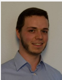
Mirco Roszbach Public Relations PARLA GmbH & Co. KG

E-Mail: info@parla.de Internet: www.parla.de